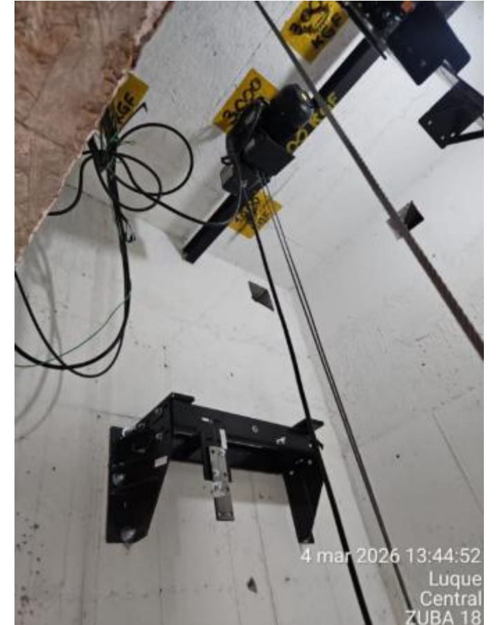
Colocación de pisos en departamentos – Elevación de muro lindero – Montaje de ascensor